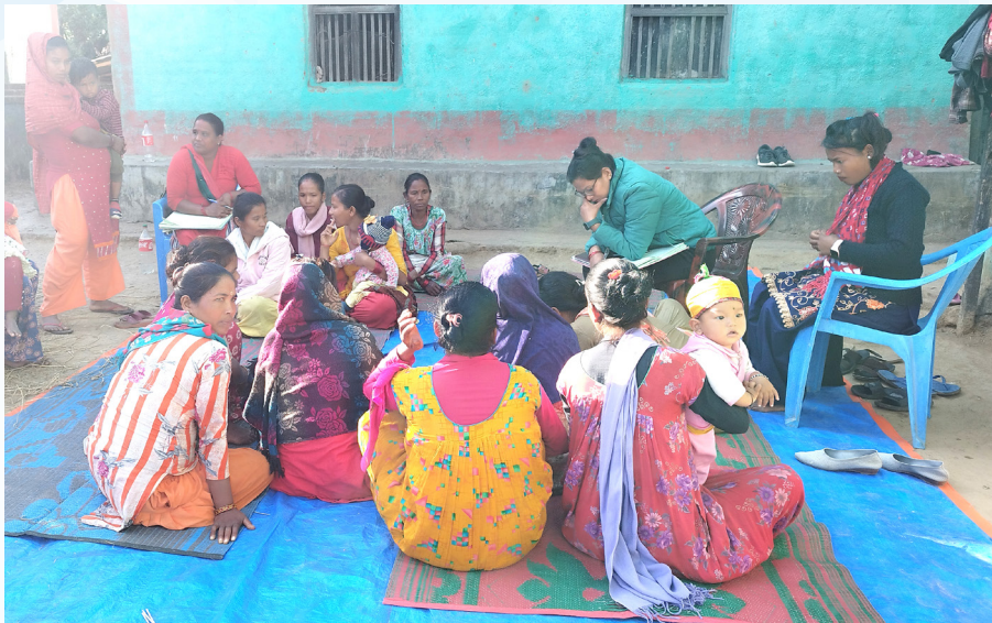
घोराही २ सुर्केडाँगीको जलजला महिला कृषि समूह नियमित बैठक बस्दै

महिलाहरू समूहमा आवद्ध भएर सीप सिक्ने, आत्मविश्वास जगाउने तथा वित्तीय साक्षरताका बारेमा धेरै कुराको ज्ञान हासिल गरेर कृषि पेशामा जोडिनुभएको छ ।